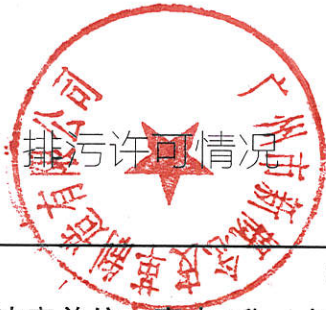
表 5 排污许可情况