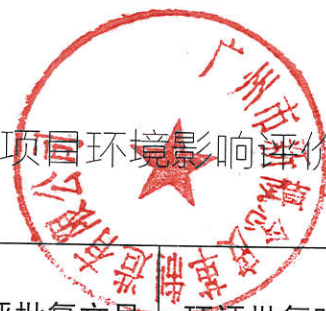
表 4 建设项目环境影响评价情况