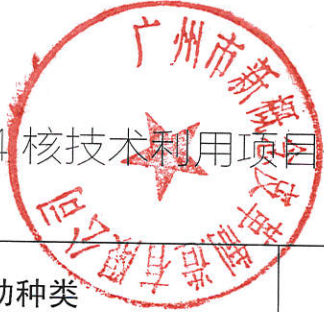
表 2-4 核技术利用项目信息