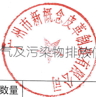
表 2-2 上年废气及污染物排放信息