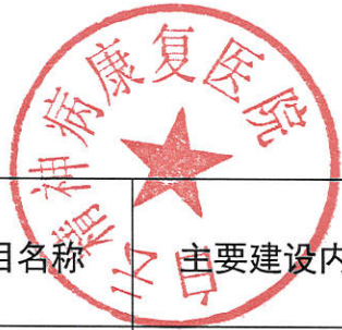
表 4 建设项目环境影响评价情况