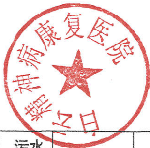
表 2-1 上年污水及污染物排放信息