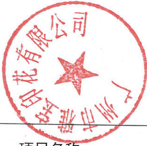
表 2-4 核技术利用项目信息