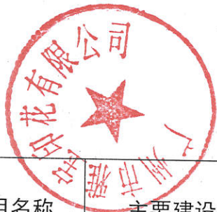
表 4 建设项目环境影响评价情况