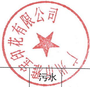
表 2-1 上年污水及污染物排放信息