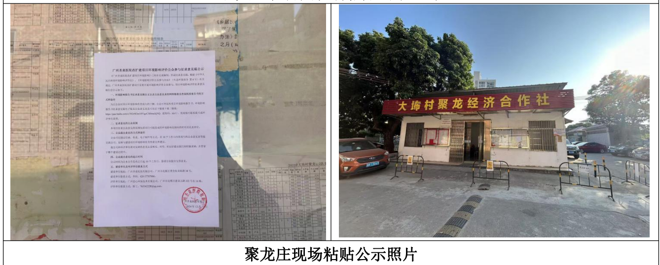
聚龙庄现场粘贴公示照片