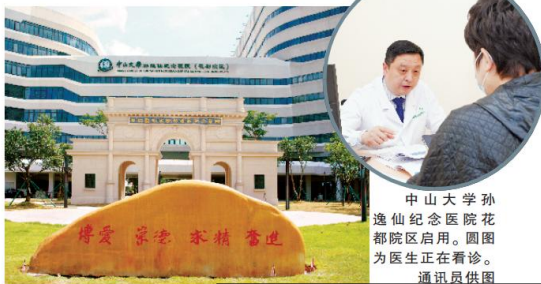
中山大学孙逸仙纪念医院花都院区启用。图为医生正在看诊。