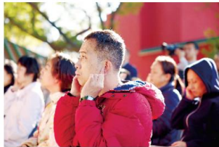
街坊听养肾肾穴按摩手法讲解。