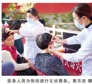
医务人员为街坊进行穴位按摩手法讲解。