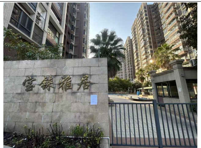
宝徕雅居现场粘贴公示照片