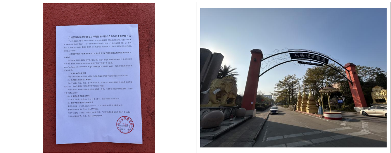
石头记矿物园现场粘贴公示照片

张贴区域选取的符合性分析：本项目征求意见稿公示选取本项目利益相关者作为张贴区域，分别于石头记矿物园、聚龙庄、宝铗雅居、大布村公告栏、文化广场等易于知悉的场所张贴公告，并持续公开不少于10个工作日，符合《环境影响评价公众参与办法》要求。