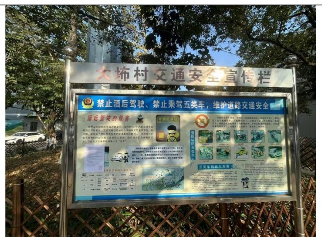
大布村现场粘贴公示照片