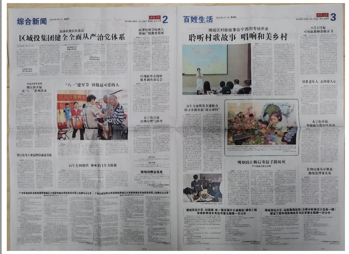
图 3-2 征求意见稿第一次登报公示照片