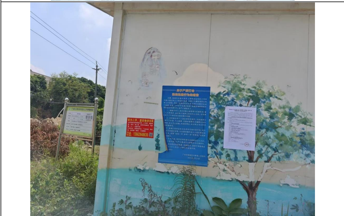
图 3-4 征求意见稿公示现场张贴