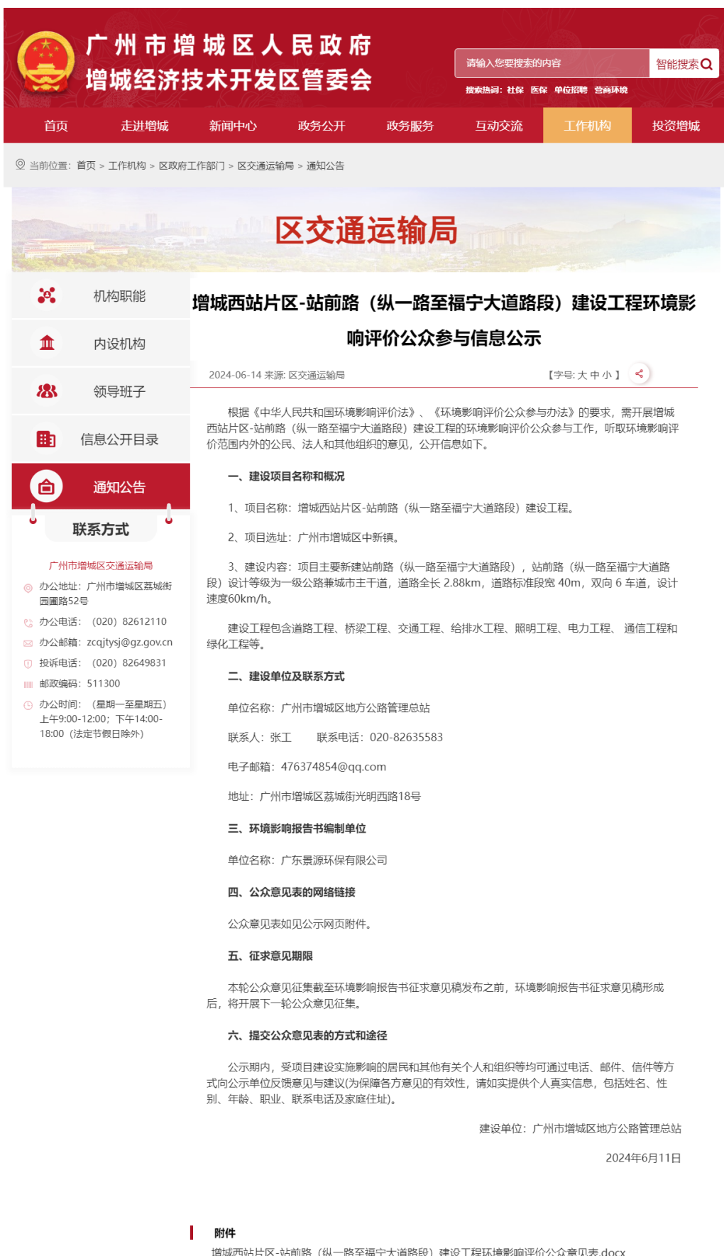
图 2-1 首次环境影响评价信息网上公开截图