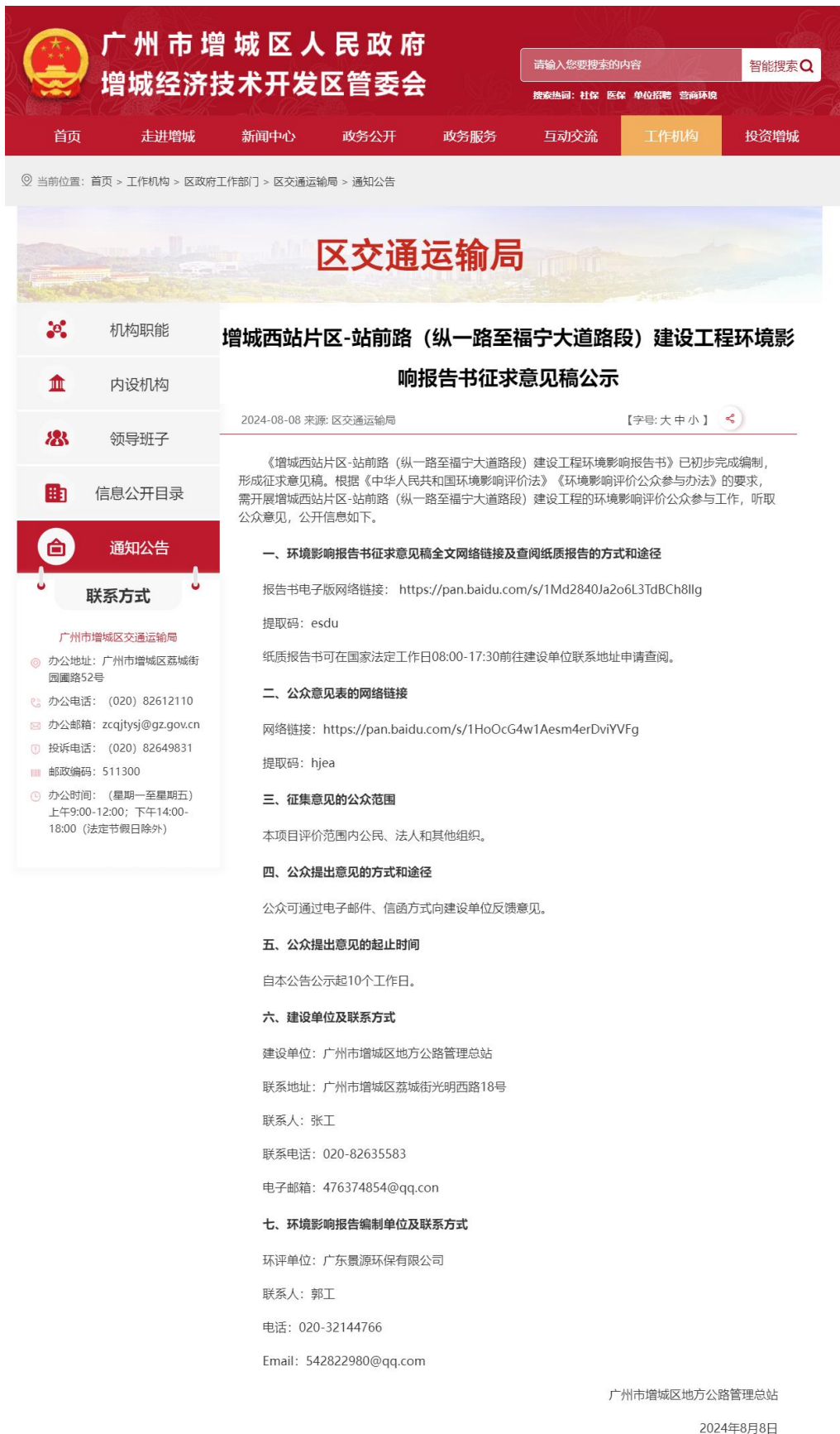
图 3-1 征求意见稿网上公示照片