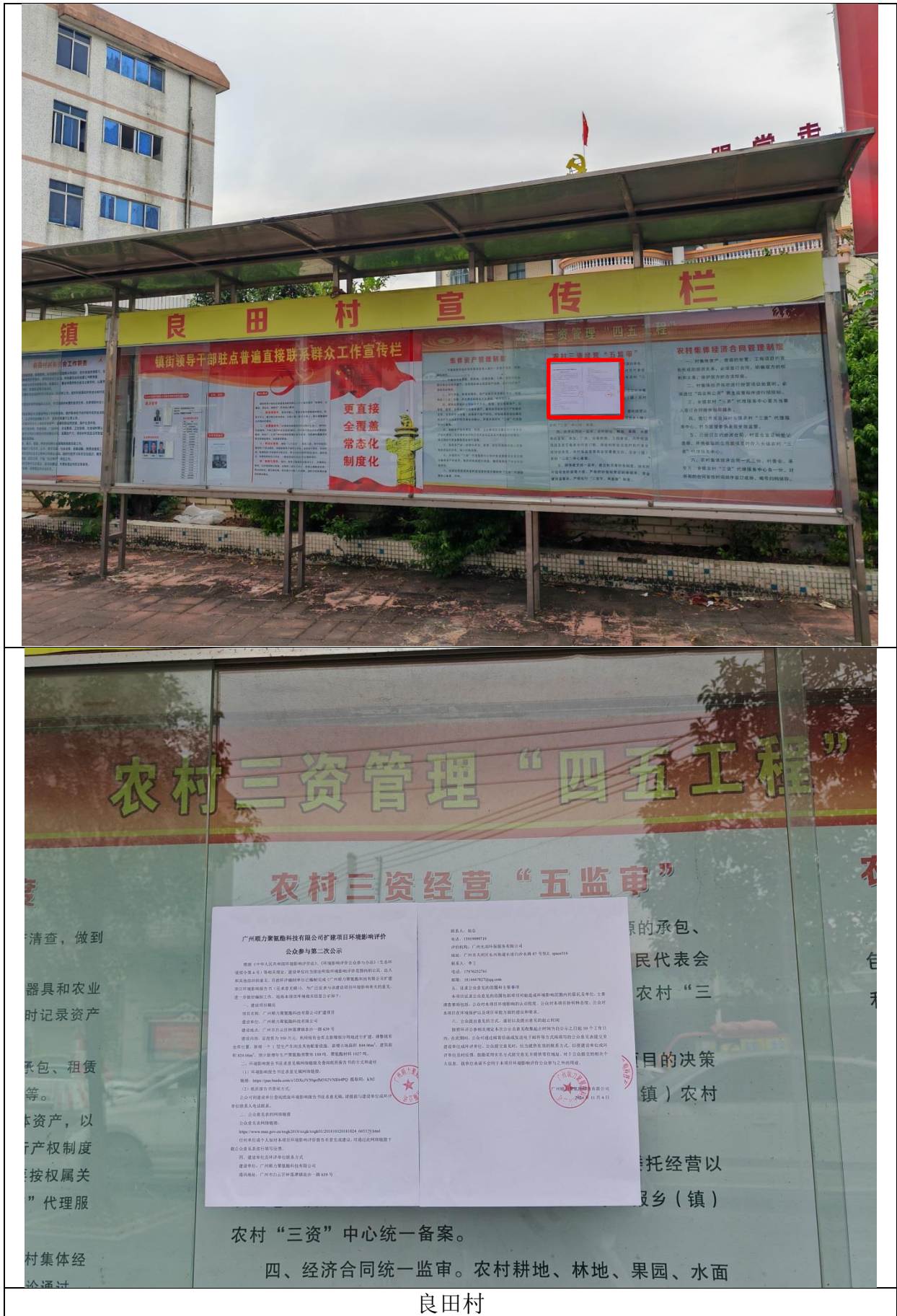
图 4 征求意见稿公示（第二次公示）现场张贴公示照片