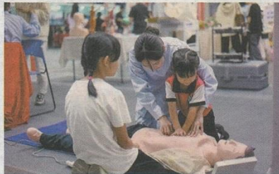
2024年广东省“南粤家政”技能交流展示暨大型招聘对接“五个一”活动11月9日举行,小朋友现场学习急救知识。

在中山主会场,主办方邀请了来自粤港澳、省际协作地区的家政服务企业和院校、机构设摊参会,活动现场对接洽谈区、服务体验区、银发经济区、交流展示区等四大功能区共设置摊位超220个,入场参与活动超过5000人次,现场校企对接洽谈初步达成合作意向超100个。其中,银发经济区聚焦老年人的生活需求与养老服务的发展,以养老健康为纽带,围绕养老+医疗、陪诊、陪餐、助浴、养生等多业态融合发展。58家养老服务领域上下游企业受邀参加,通过新设备、新服务、新