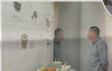
三彩鸭衔梅花杯。观众在了解支烧工艺。

广州是海上丝绸之路东端的重要港口和商业都会,持续繁荣两千多年,从未间断。在陶瓷逐渐成为外贸产品大宗的唐代,广州扮演了各地窑口产品集散枢纽的关键角色。历年来,广州考古发现了各地窑口的陶瓷器,其中有一些来自于巩义窑的蓝釉、三彩、白釉彩绘和白釉绿彩器。此外,1998年发现的“黑石号”沉船出水巩义窑陶瓷以及用广东罐包装的长沙窑瓷器等,表明