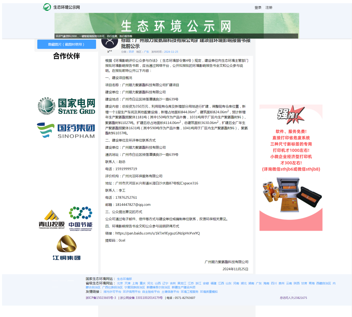
图 6 网站公示截图