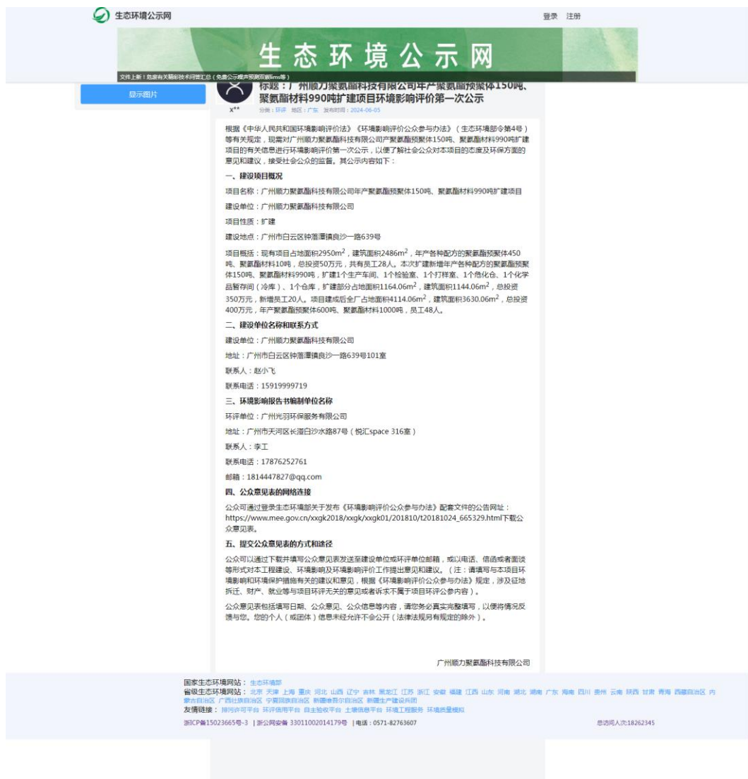
图1 项目第一次网上公示截图