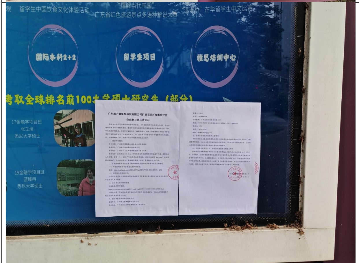
广东外语外贸大学南国商学院