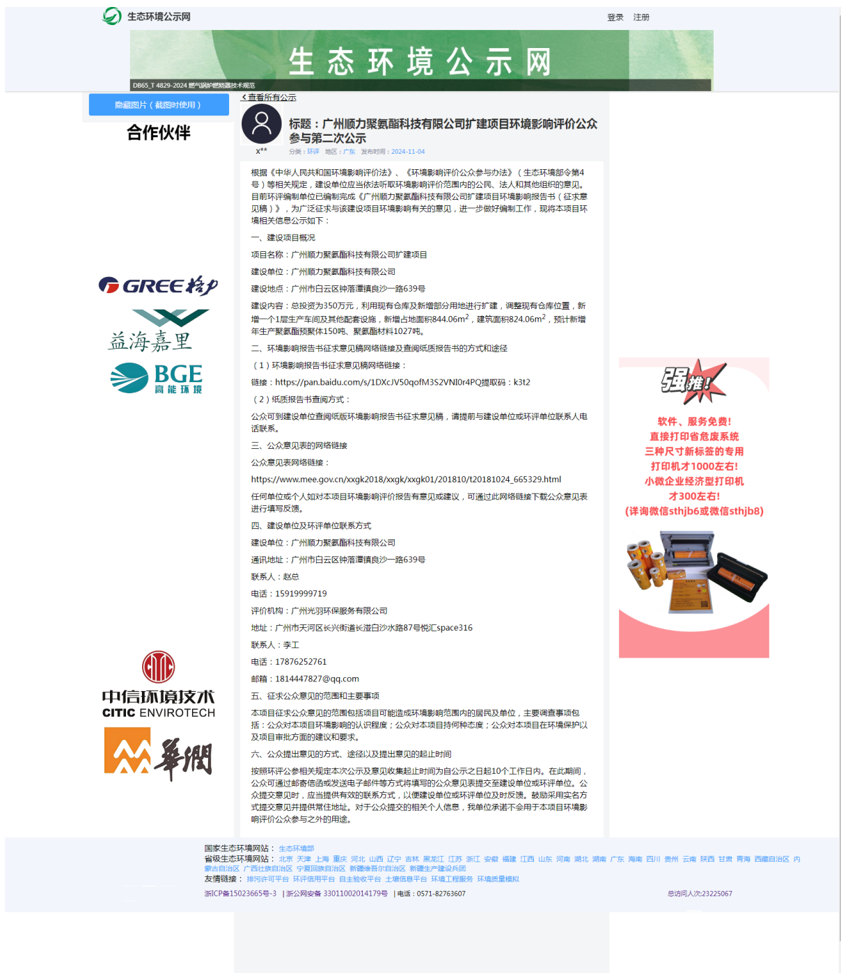
图 2 项目第二次网上公示截图