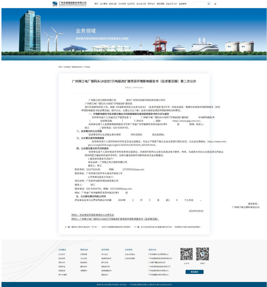
图 5-1 本项目征求意见稿环境影响评价信息网上公示截图