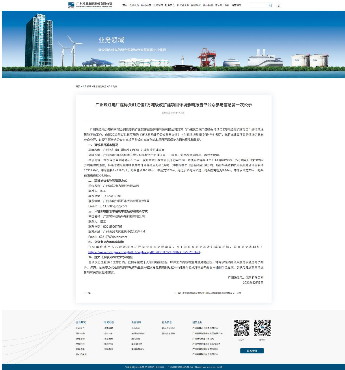
图 4-1 本项目首次环境影响评价信息公示截图