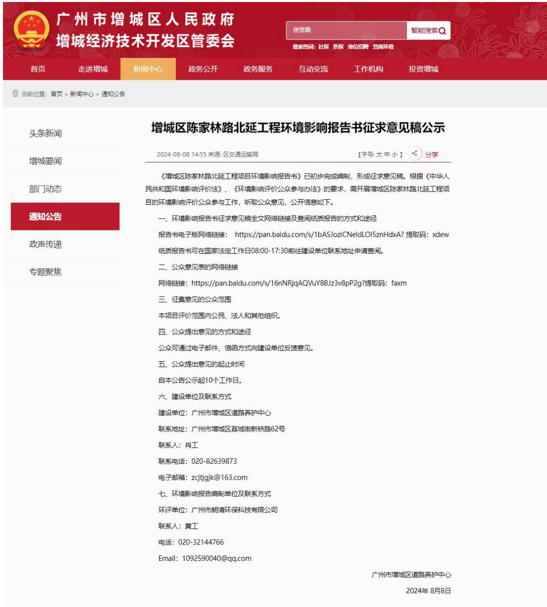
图 3-1 征求意见稿网上公示照片