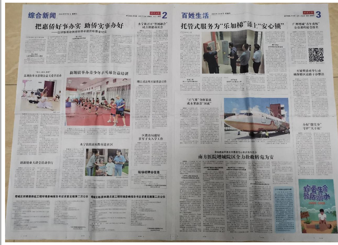
图3-3 征求意见稿第二次登报公示照片