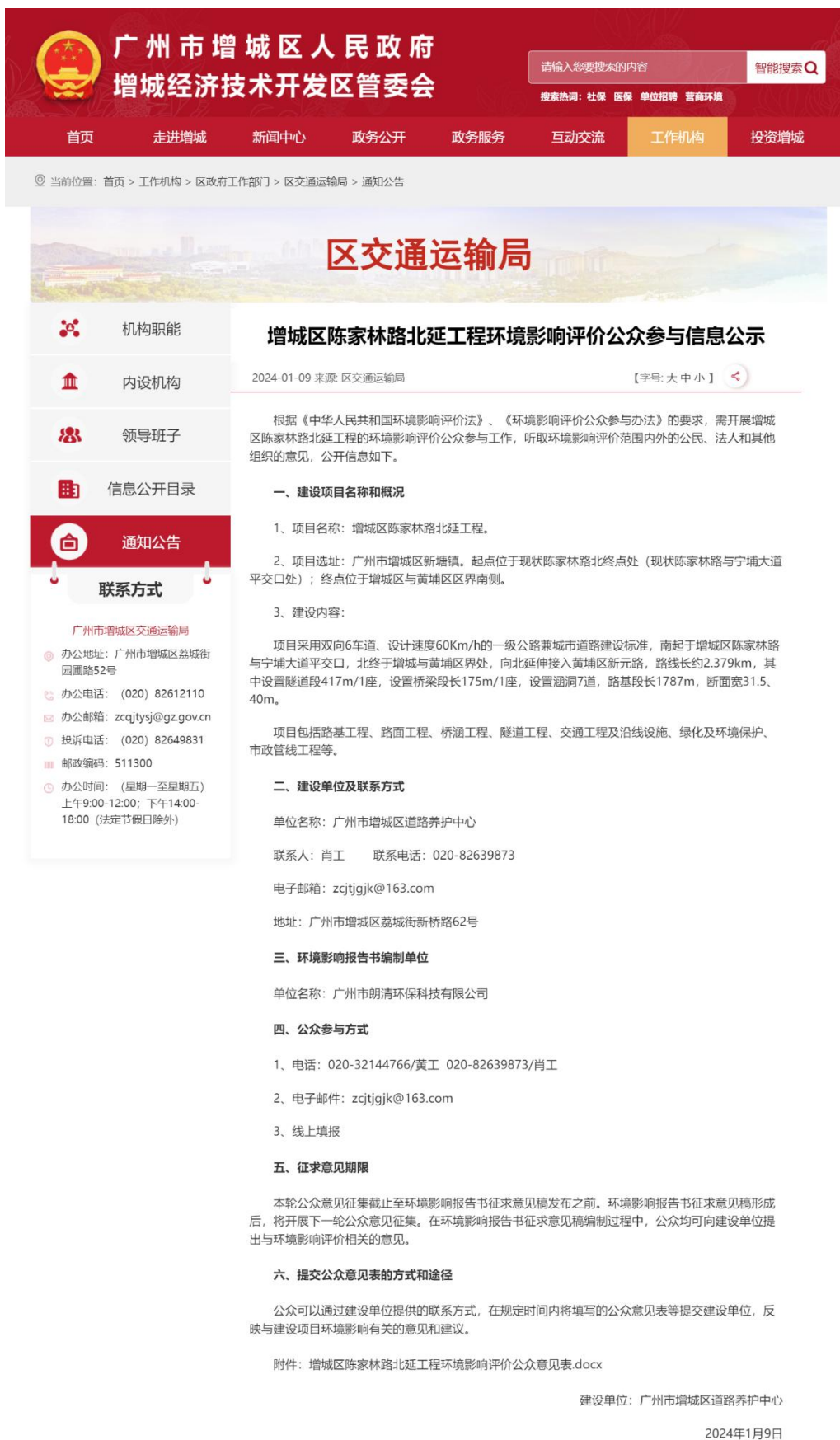
图 2-1 首次环境影响评价信息网上公开截图