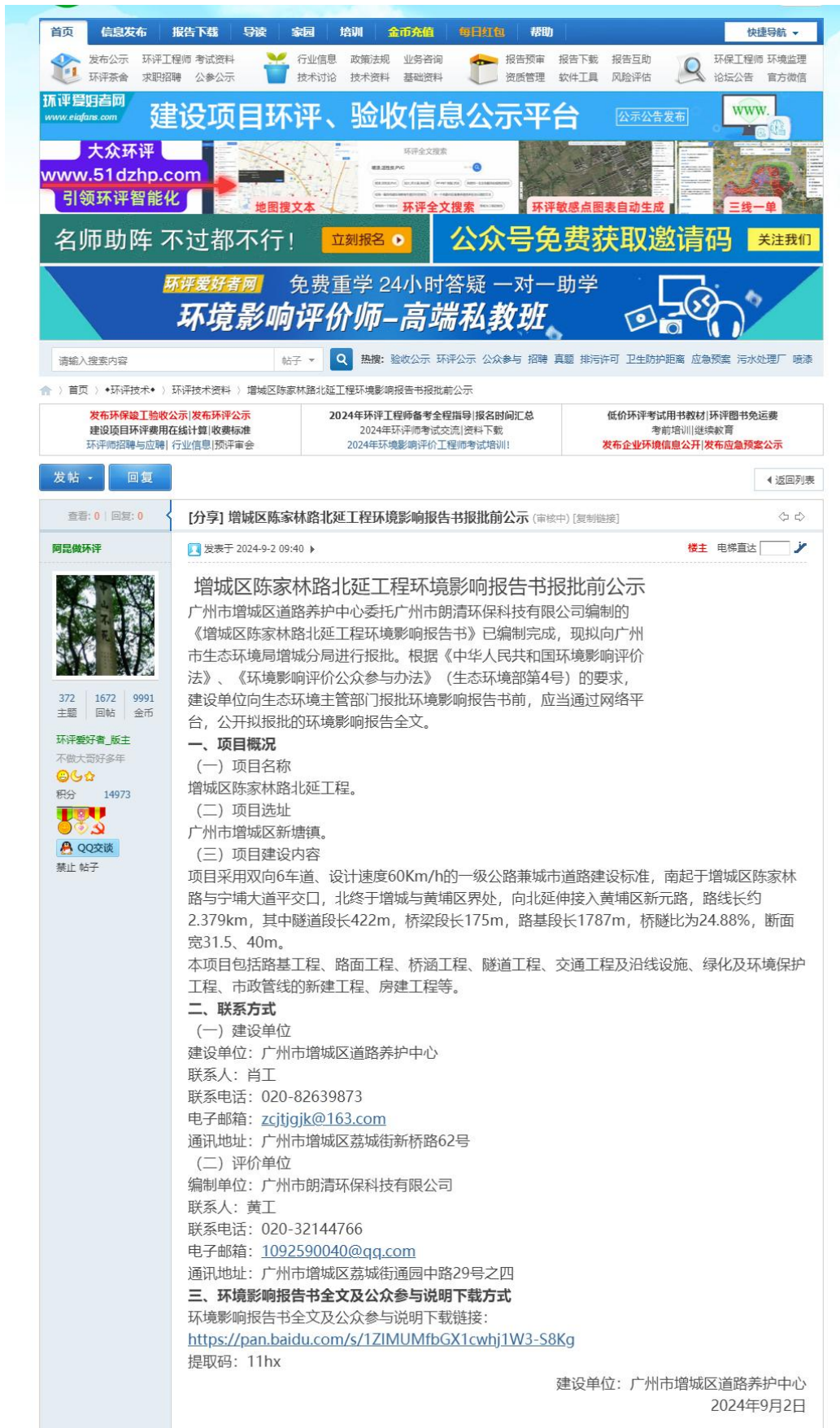
图 4-1 环评报批前公示截图