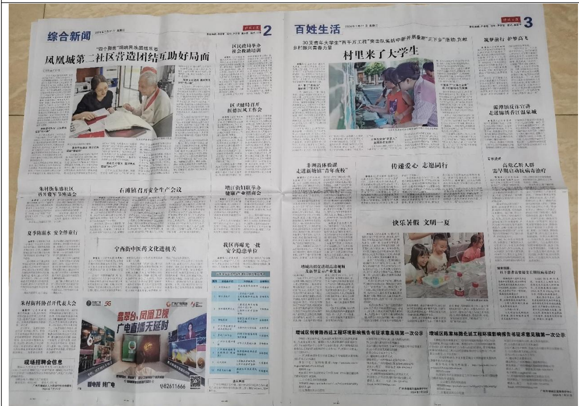
图 3-2 征求意见稿第一次登报公示照片