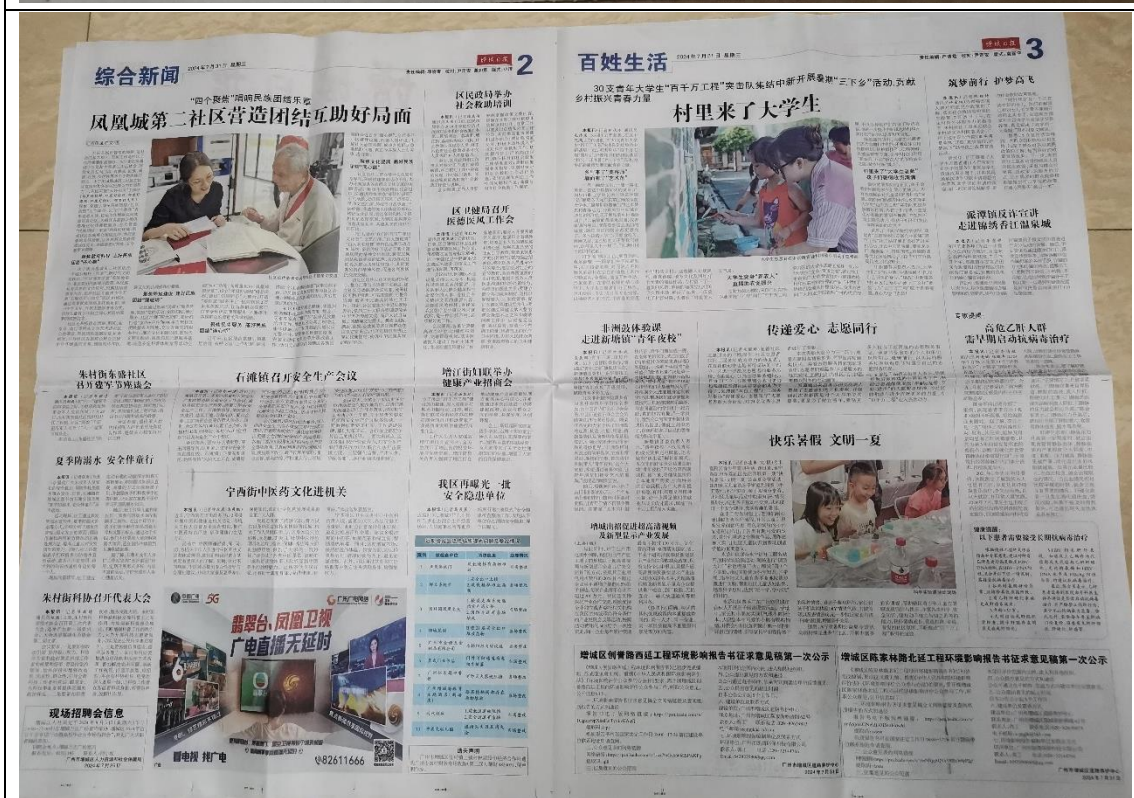
图 3-2 征求意见稿第一次登报公示照片