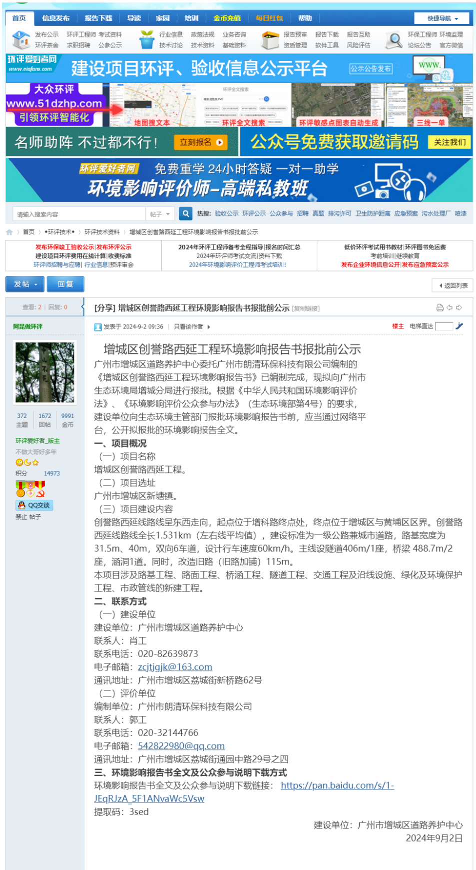
图 4-1 环评报批前公示截图