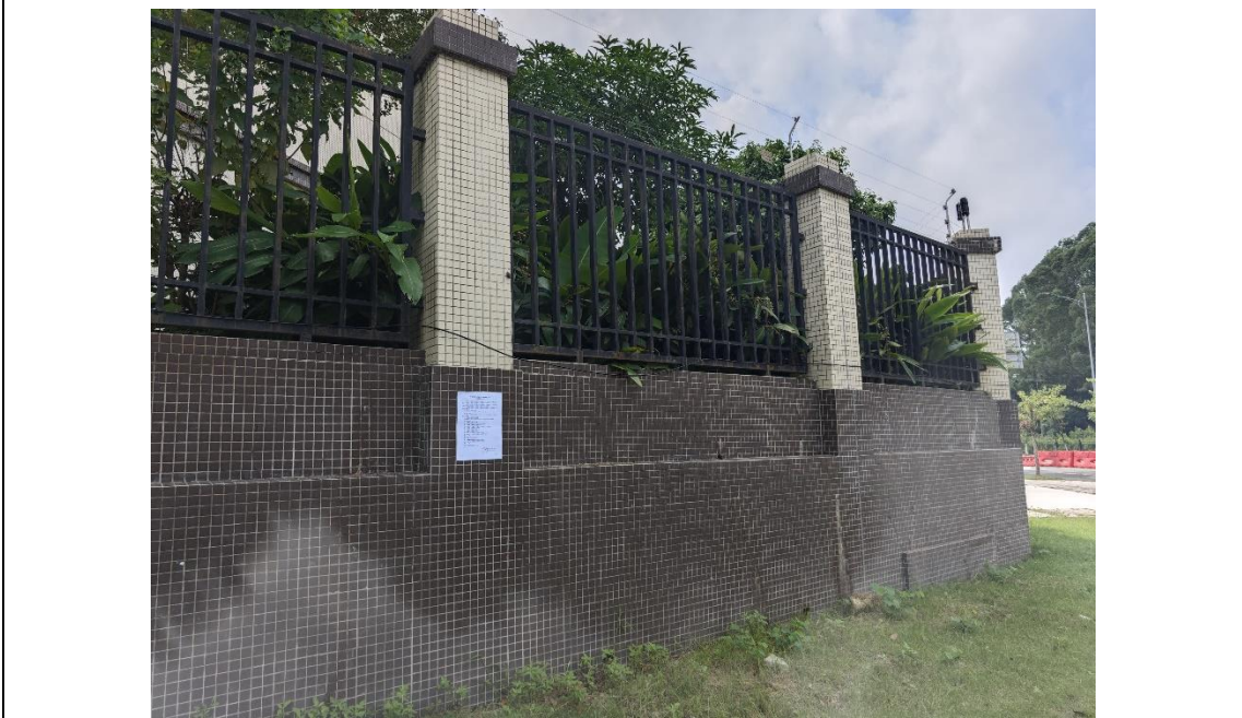
广州斐特思公学学校