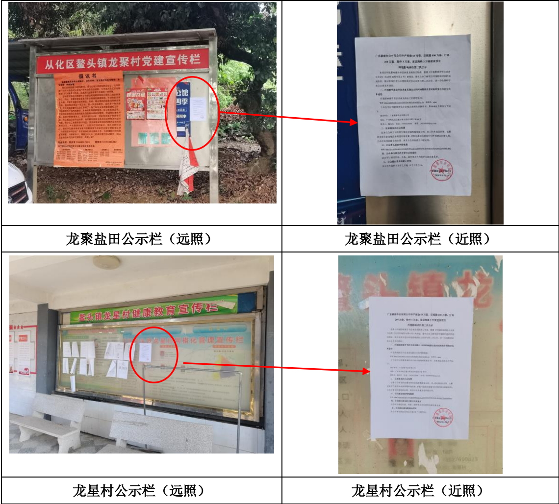
图 3.2-4 征求意见稿公示现场张贴照片