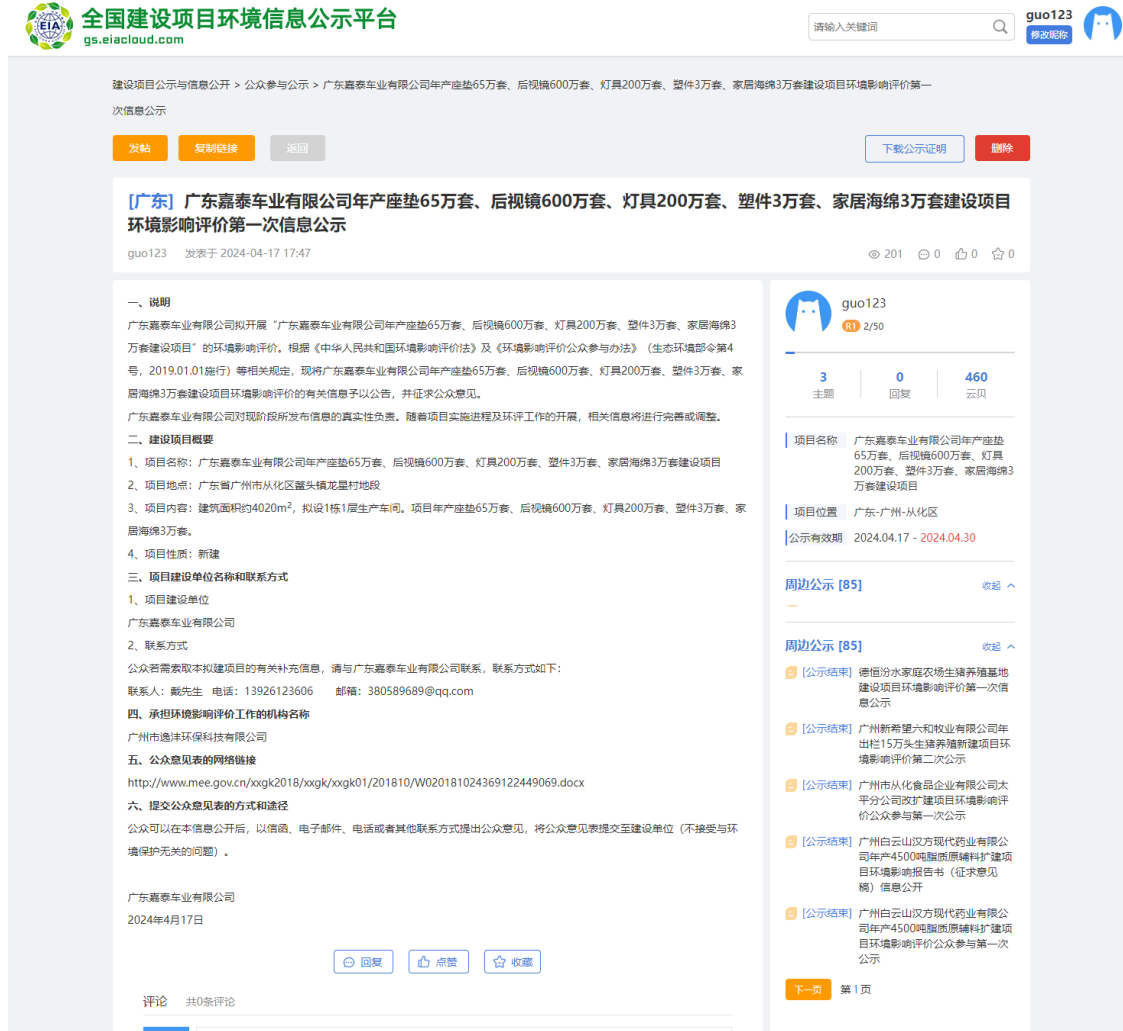
图 2.2-1 项目首次环境影响评价信息公示截图

本项目在全国建设项目环境信息公示平台网站 ( https://www.eiacloud.com/gs/ ) 首次公开环境影响评价信息期间未收到公众提出意见。