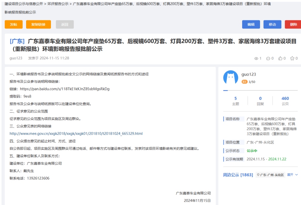
图 6.2-1 项目报批前全本网站公示截图

载体选取的符合性分析： 报批前公开方式采用建设项目所在地且公众易于接触的网络平台，于 2024 年 11 月 15 日在网上公开拟报批的环境影响报告书全文和公众参与说明。因此本项目报批前公开载体的选取 符合《环境影响评价公众