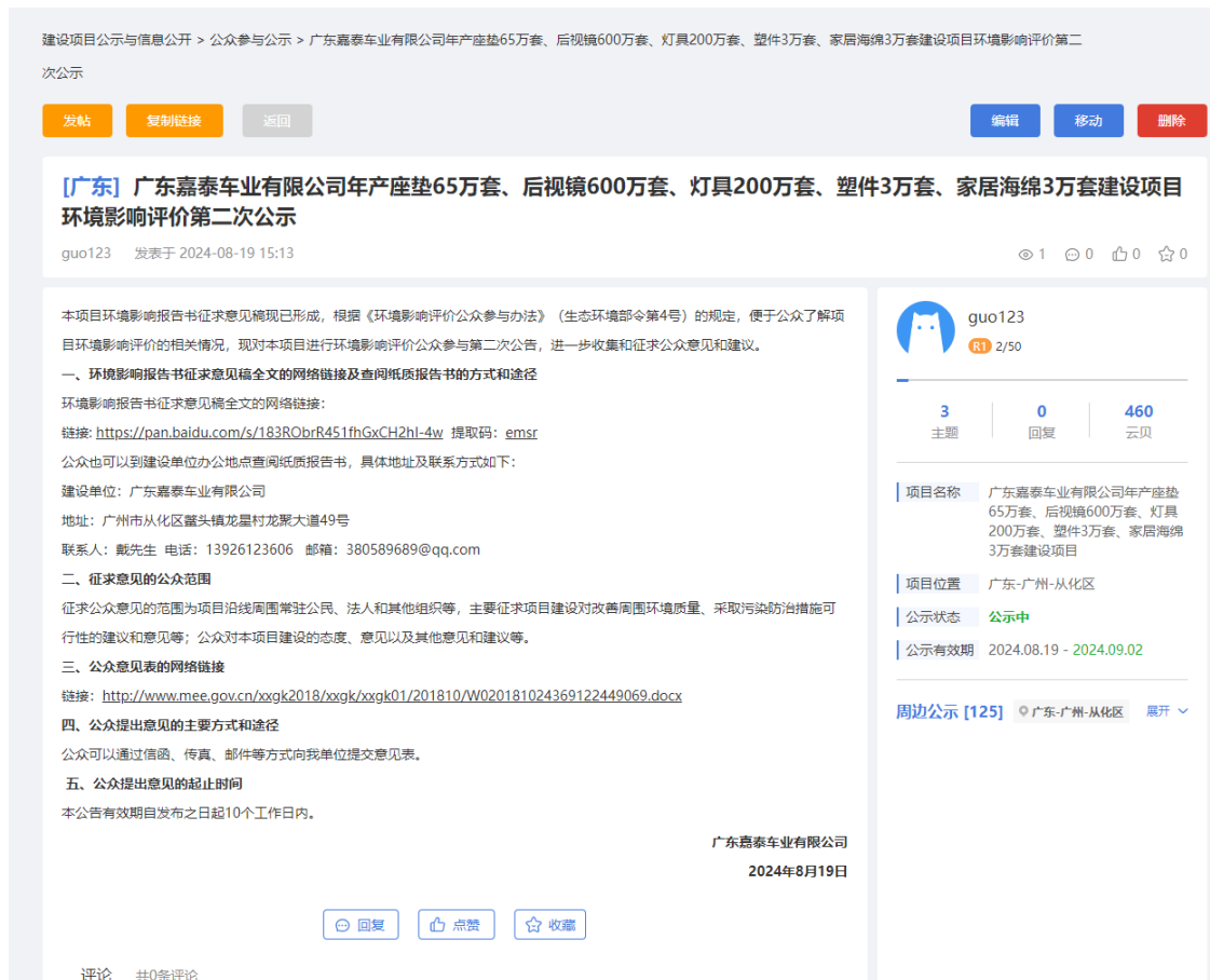
图 3.2-1 项目征求意见稿网上公示截图