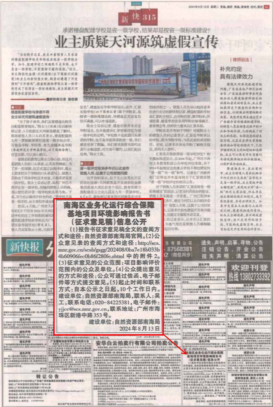
图 3.2-2 报纸公示 (2024年 8月 13日)