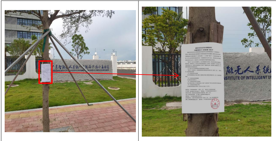
广东智能无人系统研究院（龙穴岛园区）