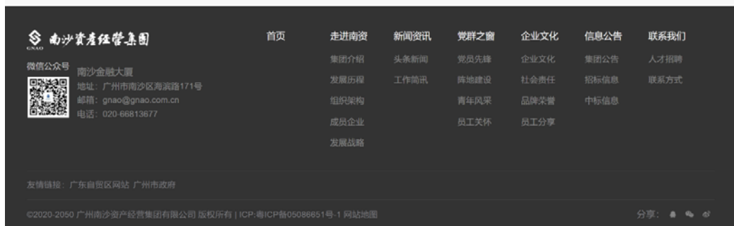
图6-1 本项目在南沙资产经营集团网站报批前公示图