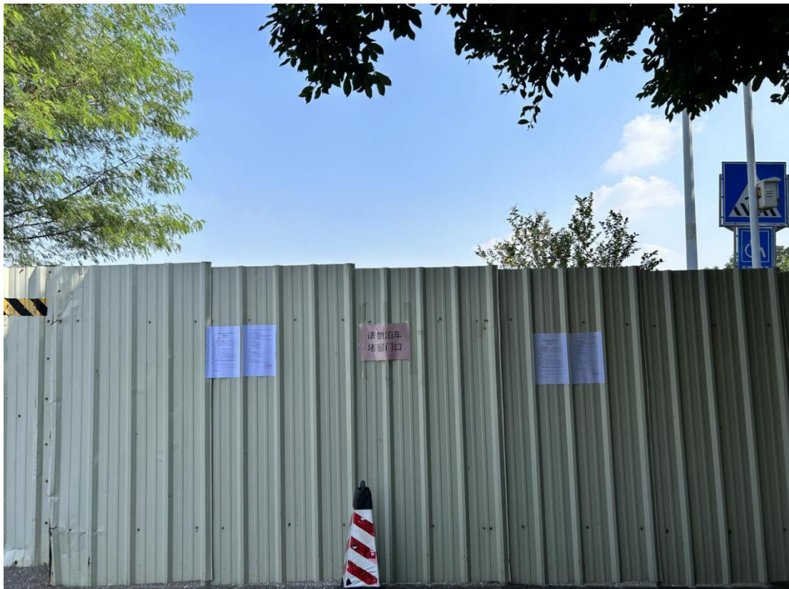
南沙区人民法院附近（原横档岛旅游过海码头附近）