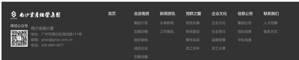
图3-1 本项目在南沙资产经营集团网站征求意见稿公示图

跨境电商商务仓租（南沙）保税中心二期（自编8#仓库）水土保持设施验收... 2019-11-20