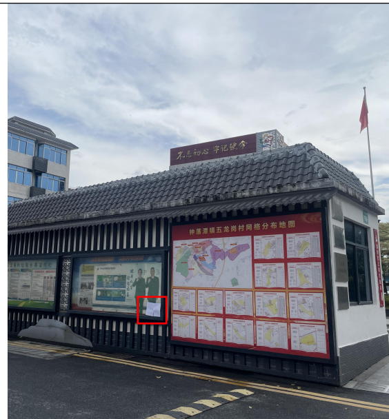
五岗村张贴现场公示（远照）