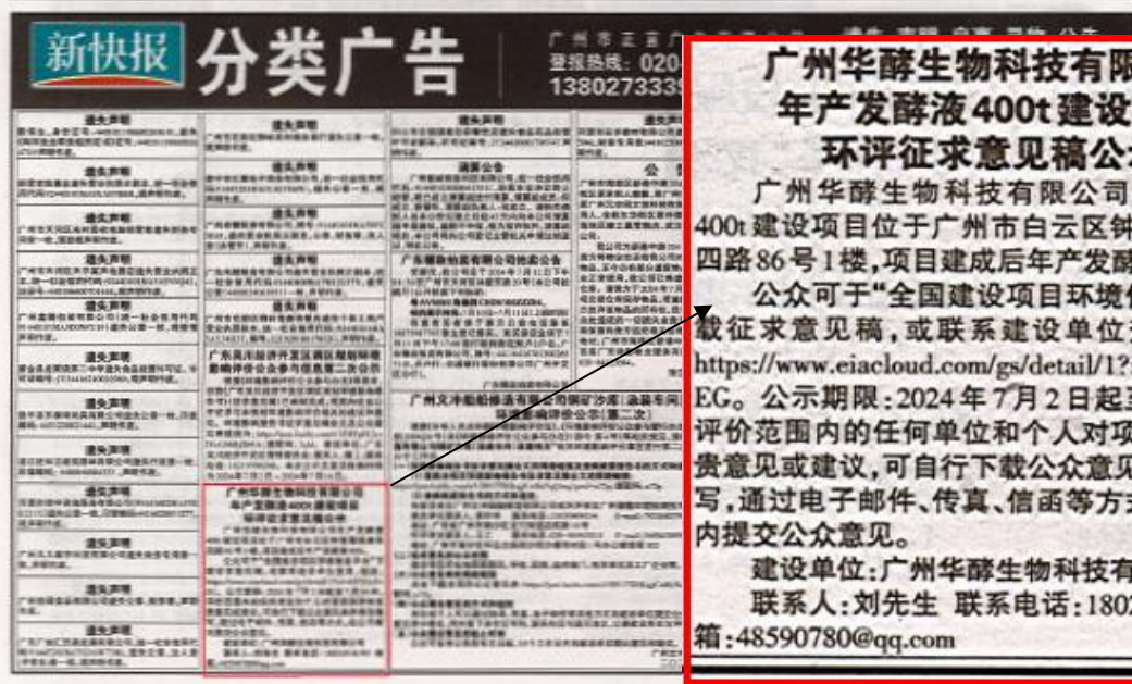
图 4.2-3 2024 年 7 月 5 日征求意见稿登报公示照片（第二次）