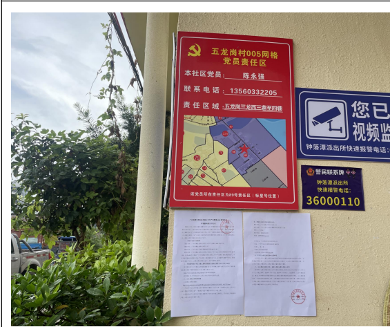
五岗村 1 张贴现场公示（近照）