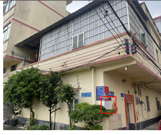
五岗村 1 张贴现场公示（远照）