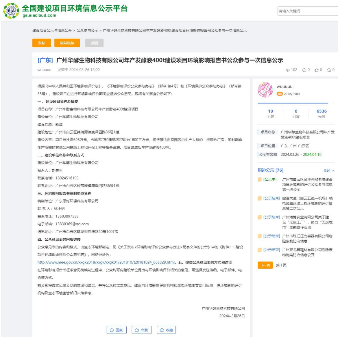
图 3.2-1 首次环境影响评价信息公开截图（全国建设项目环境信息公示平台）