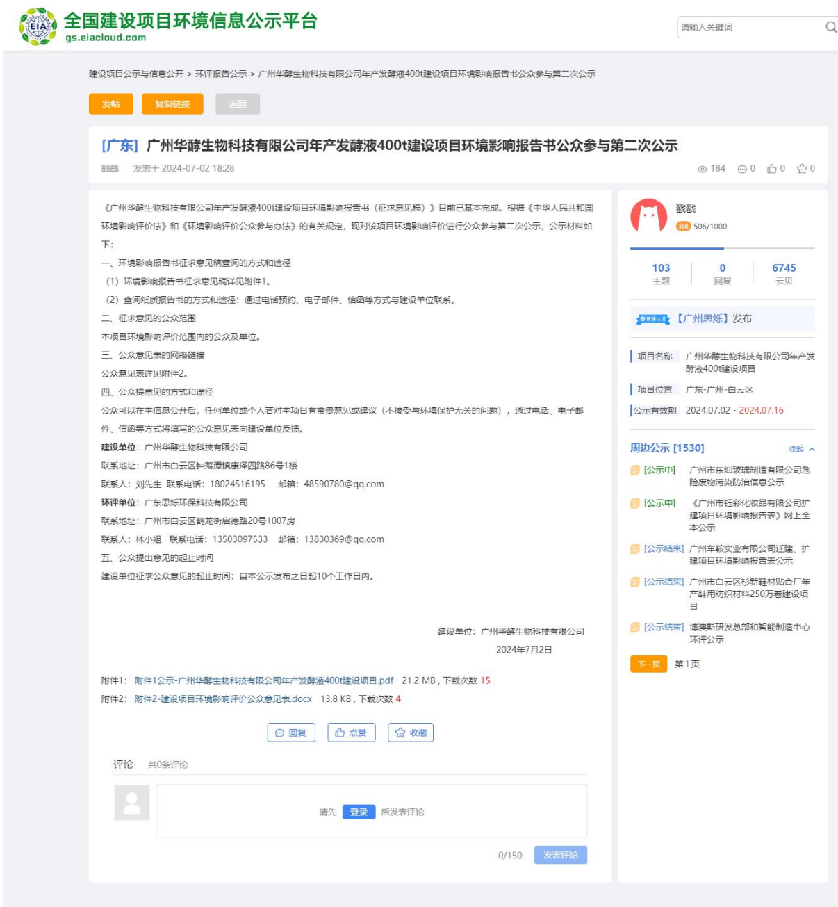
图 4.2-1 征求意见稿环境影响评价信息公开截图（全国建设项目环境信息公示平台）