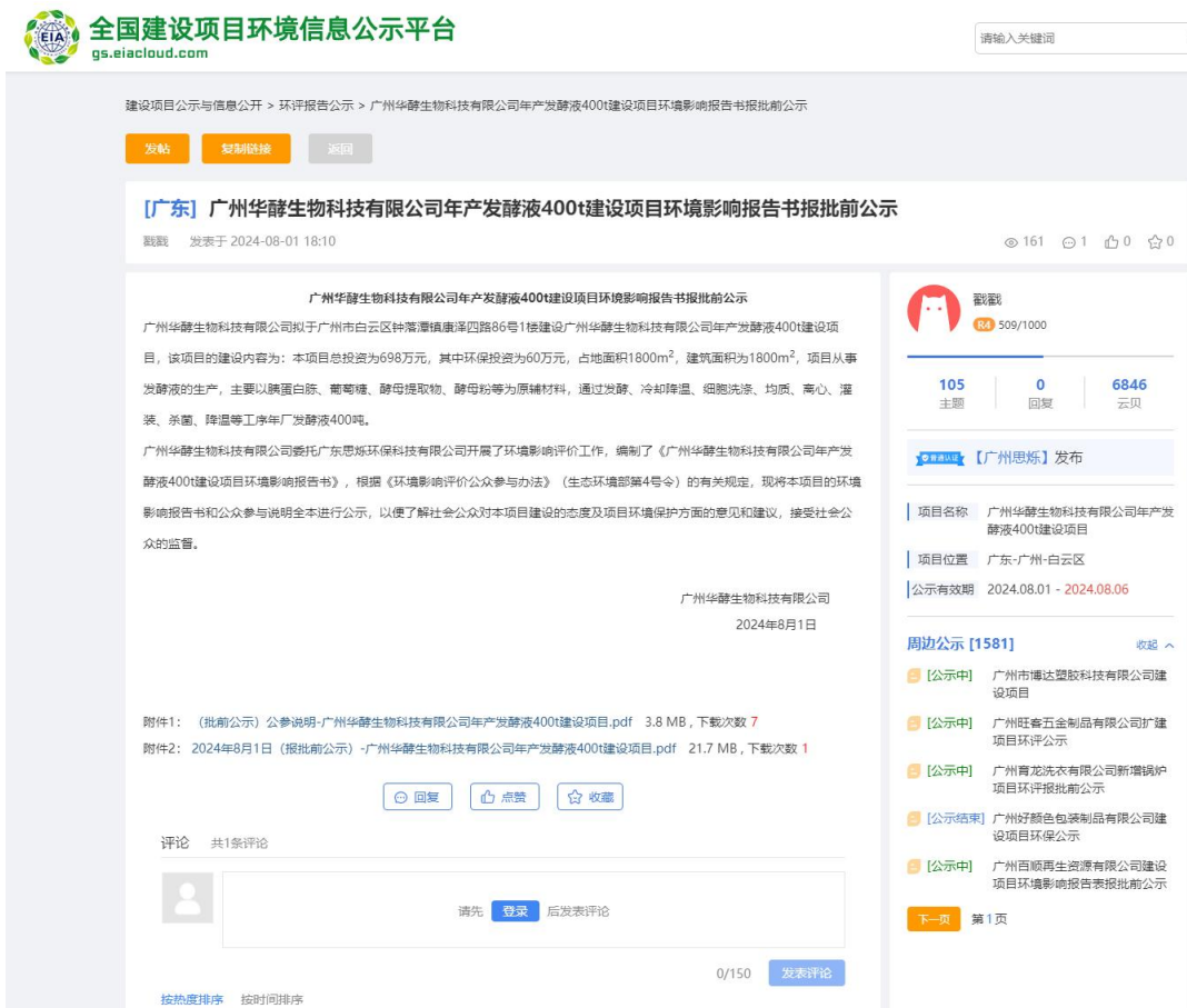
图 5.2-1 报批前公示网上公示信息截图（全国建设项目环境信息公示平台官网）