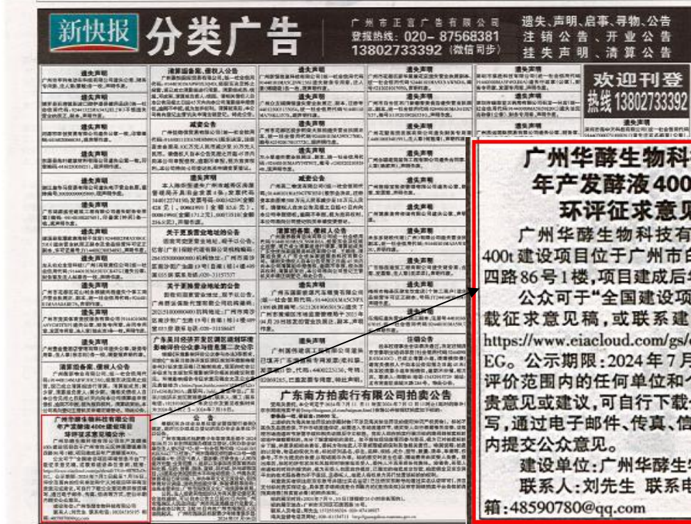
图 4.2-2 2024 年 7 月 5 日征求意见稿登报公示照片（第一次）