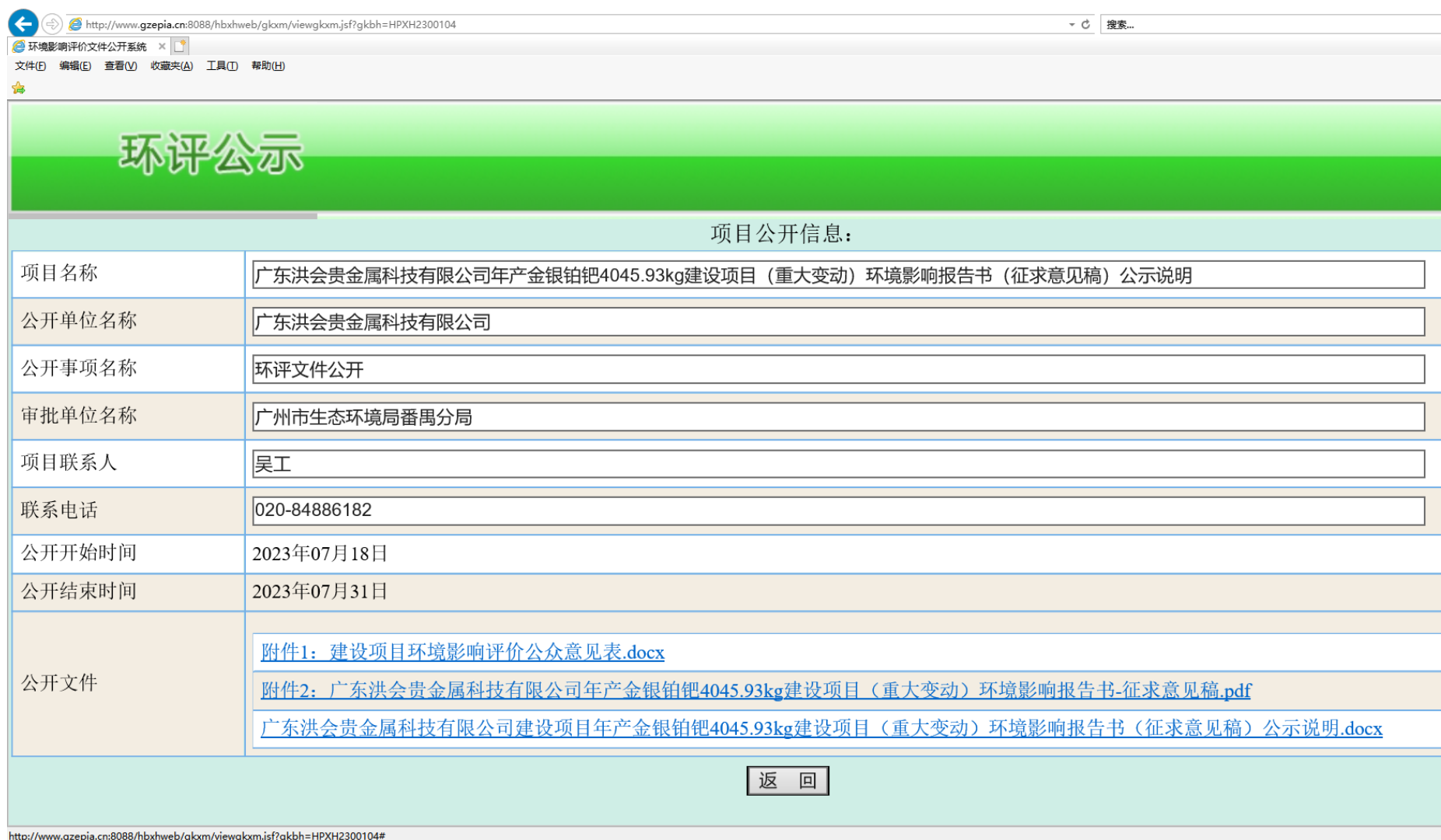
图 5.2-1 征求意见稿网上公示截图