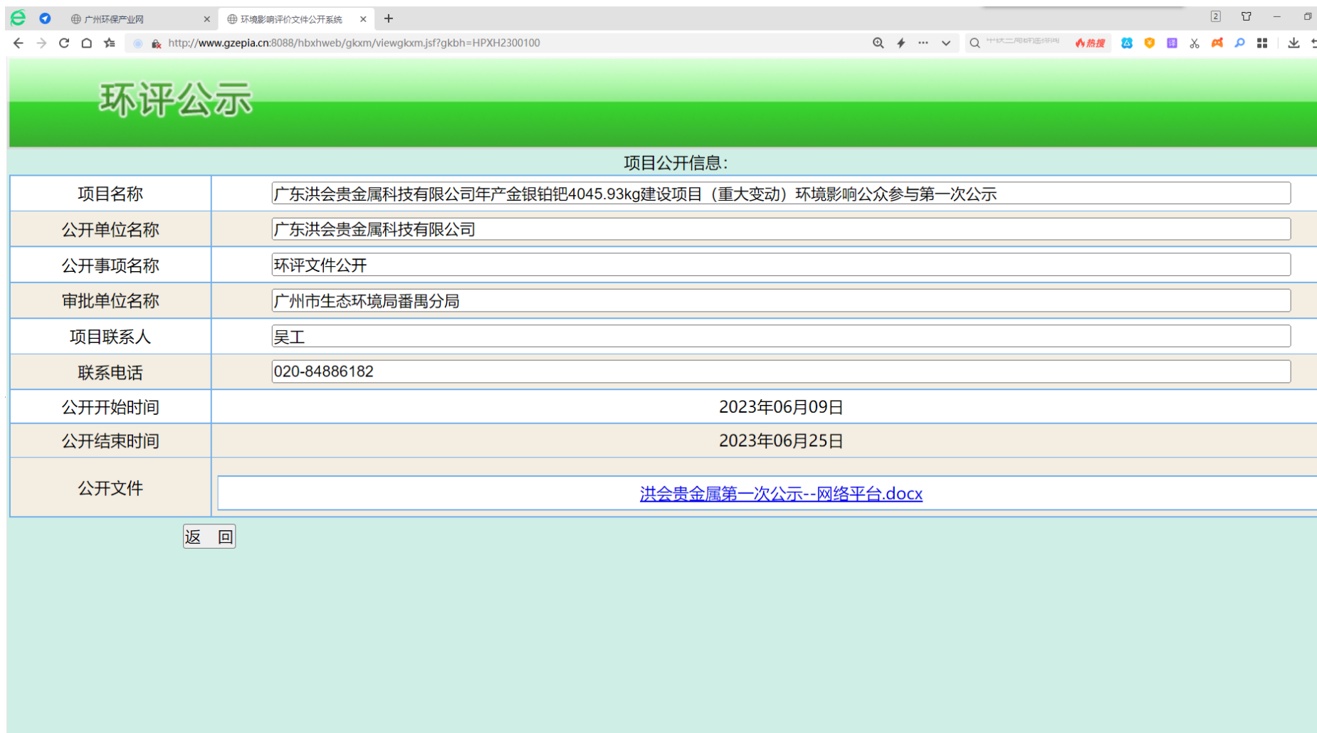
图 4.1-1 首次公开环境影响评价信息公示截图