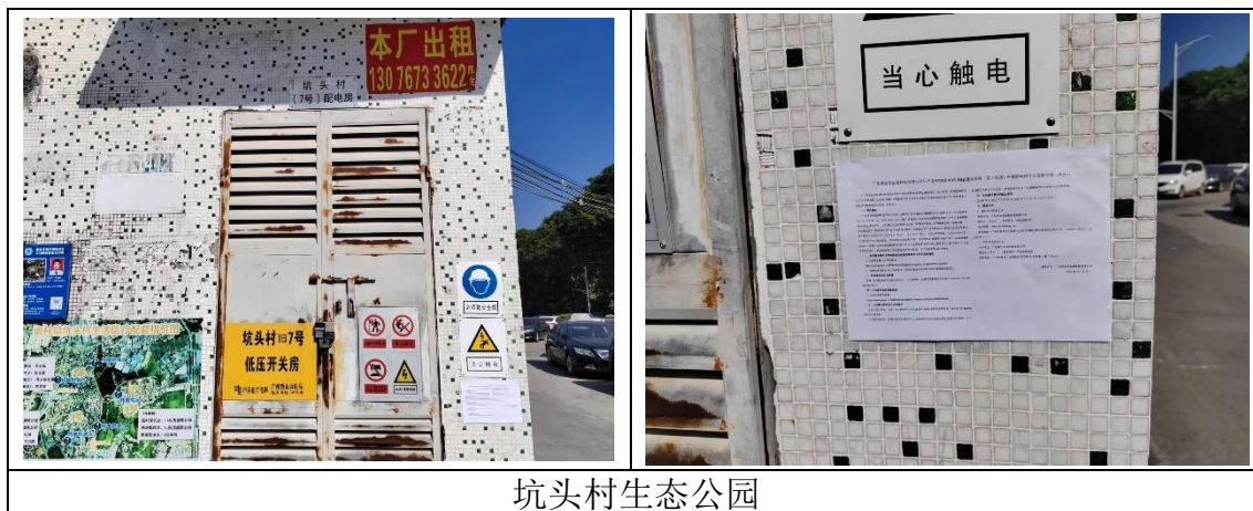
图 5.2-3 征求意见稿现场张贴公示照片