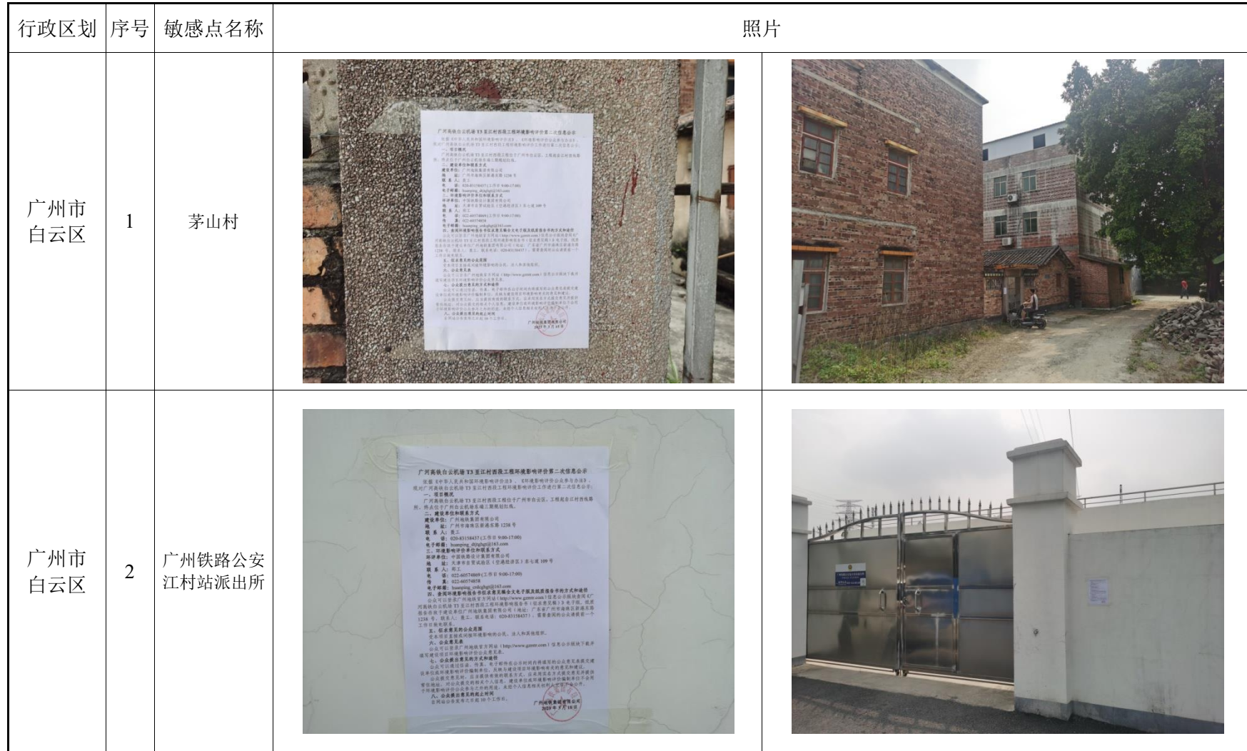
表 3-1 环境保护目标张贴公示情况表