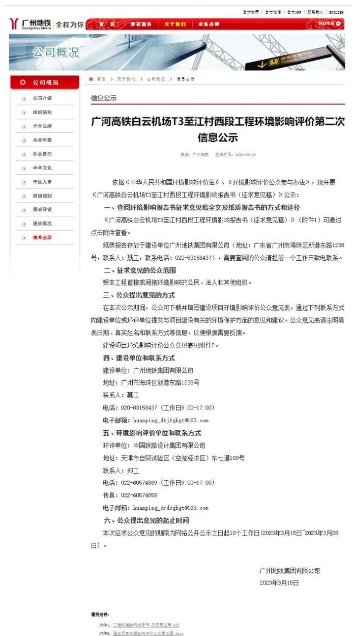
图 3-1 广河高铁白云机场 T3 至江村西段工程环境影响评价第二次公示 (广州地铁集团官方网站)

根据《环境影响评价公众参与办法》（生态环境部令第4号）第十一条，在广州地铁集团官方网站（ http://www.gzmtr.com ）进行网络公示。发布日期为2023年3月15日，公众提出意见的起止时间为2023年3月15日至2023年3月28日。网络公示的内容、格式和公开时间符合《环境影响评价公众参与办法》的相关要求。网络公示见图3-1。