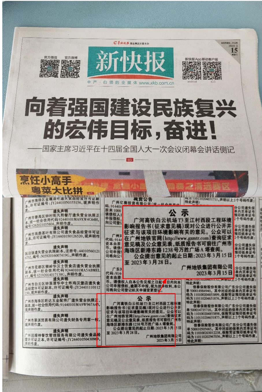
图 3-2 广河高铁白云机场 T3 至江村西段工程环境影响评价报告书征求意见稿报纸公示

根据《环境影响评价公众参与办法》第十一条要求，于 2023 年 3 月 15 日与 2023 年 3 月 22 日在由广州羊城晚报报业集团主办、广东省全省发行的《新快报》进行信息公示。本次环评公示征求意见时间为 2023 年 3 月 15 日至 2023 年 3 月 28 日，公示次数为 2 次，满足征求意见的 10 个工作日内公开信息不得少于 2 次的要求。2023 年 3 月 15 日登报见图 3-2，2023 年 3 月 22 日登报见图 3-3。