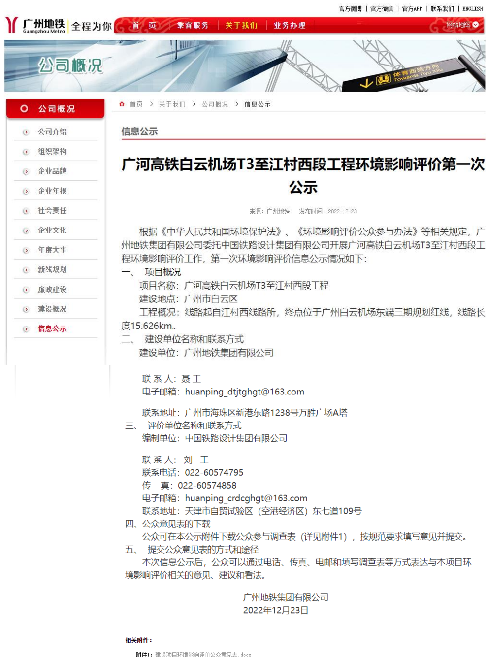
图 2-1 广河高铁白云机场 T3 至江村西段工程环境影响评价第一次公示

根据《环境影响评价公众参与办法》(生态环境部令第4号)第九条的相关要求,在广州地铁集团官方网站( http://www.gzmtr.com )进行网络信息公开,发布日期为2022年12月23日。网络公开的内容、格式和公开时间符合《环境影响评价公众参与办法》的相关要求。网络公示见图2-1。