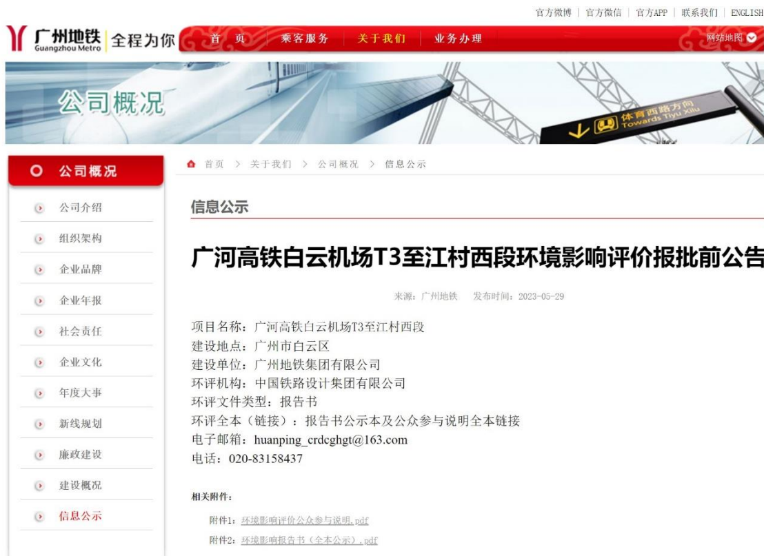
图 6-1 广河高铁白云机场 T3 至江村西段环境影响评价第三次公示 (广州地铁集团官方网站)